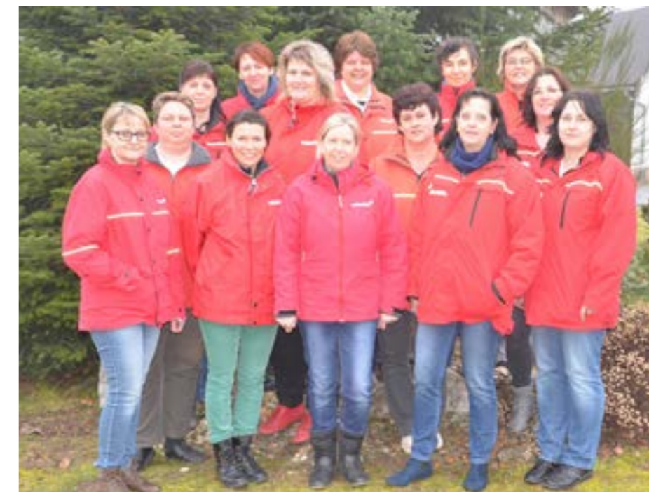
(alle Heimhelferinnen der Volkshilfe Raum Bad Radkersburg, außer Marija U.)

Kontakt Telefonisch erreichen Sie uns unter 03474/70510 von Montag bis Donnerstag in der Zeit von 8.00 bis 12.30 Uhr. Büroöffnungszeiten sind Dienstag, Mittwoch und Donnerstag von 8.00 bis 12.00 Uhr. Wir freuen uns auf Sie!