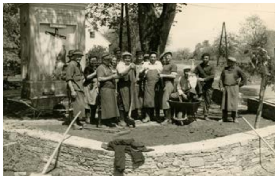
Arbeitseinsatz vor dem Zeltlinger Bildstock, 1964.

Wir bedanken uns im Voraus für Ihre Unterstützung, die zum Gelingen einer interessanten, umfangreichen und auch persönlichen Ausstellung beiträgt!