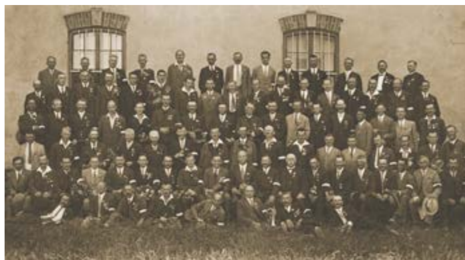
Ältestes Gruppenbild von der „Freischar“, 1930. MiaZ

Detailliert wurden die Kampfhandlungen vom 4. Februar 1919 und deren Vorbereitungen um die am 1. Dezember 1918 von SHS-Soldaten besetzte Stadt Radkersburg geschildert. Ergänzend