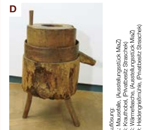
Auflösung: A: Mausefalle, (Ausstellungsstück MiaZ) B: Krauthobel, (Privatbesitz Strasschek) C: Wärmeflasche, (Ausstellungsstück MiaZ) D: Heidegrießmühle, (Privatbesitz Strasschek)