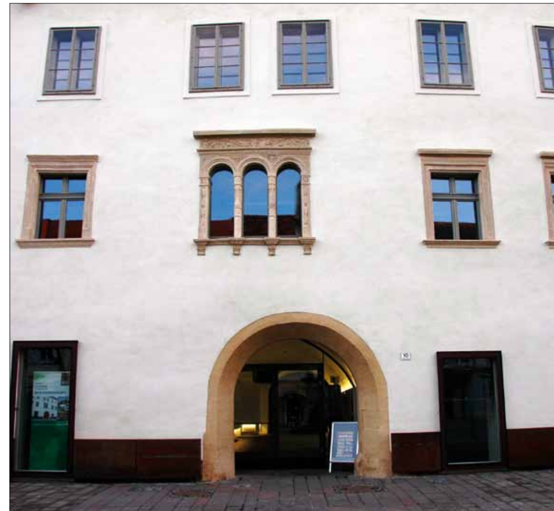
Hier schafft eine bislang unbekannte Urkunde plötzlich jede Menge an Erklärungsbedarf.