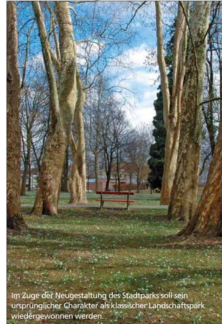
Im Zuge der Neugestaltung des Stadtparks soll sein ursprünglicher Charakter als klassischer Landschaftspark wiedergewonnen werden.