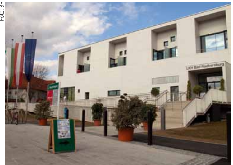
Das LKH Bad Radkersburg ist mit hohem Investitionsaufwand umgebaut bzw. erweitert worden.