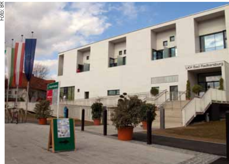
Das LKH Bad Radkersburg ist mit hohem Investitionsaufwand umgebaut bzw. erweitert worden.