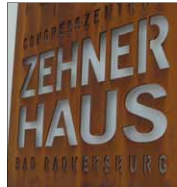
Zehnerhaus: deutliche Steigerung gegenüber 2010