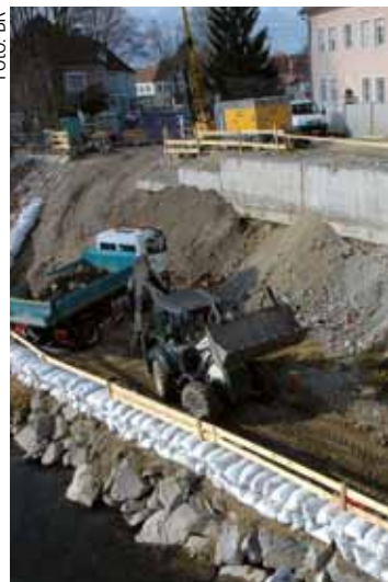
Bis Ende April werden die Bauarbeiten fertiggestellt.