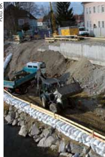
Bis Ende April werden die Bauarbeiten fertiggestellt.