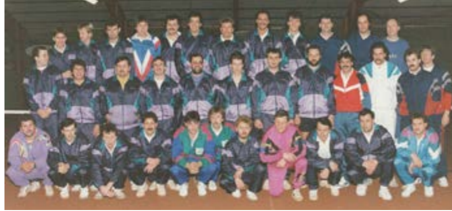
Bild: Mitglieder des HTC-Horvath im Gründungsjahr 1994